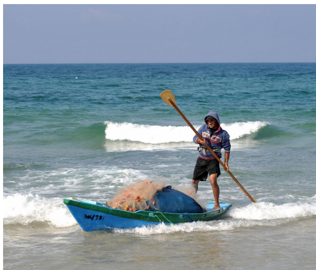
Pêcheur à Gaza